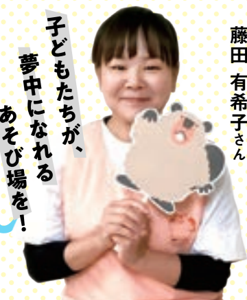
子どもたちが、 夢中になれる あそび場を!

育 児 コ ン シ ェ ル ジ ュ ・ 国 際 幼 児 健 康 デ ザ イ ン ス ベ シ ャ リ ス ト 藤 田 有 希 子 さ ん