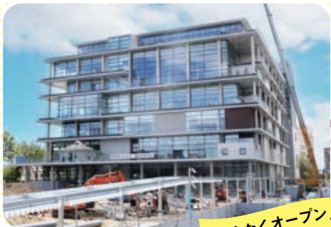
まもなくオープン!