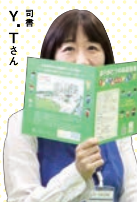
Y. T.さん 司 書