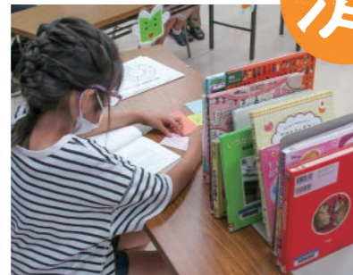
過去開催時のようす

調べものにチャレンジしたい小学3~6年生がおにクルぶっくばーくに集合!「調べる学習」のすすめ方をぶっくばーく職員がレクチャーしました。「本のさがし方のコツ」「気になることをどうやって調べるか」「調べたことのまとめ方」を体験型で学んだみんなは、とても熱心に本探しや調べものについて取り組んでいました。